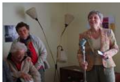
Utstillinga: "Koke elektrisk, smile mer" i arbeidarbustadane i Folgefonngata.