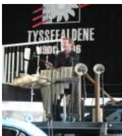
Konsert: "Music in ceramics".