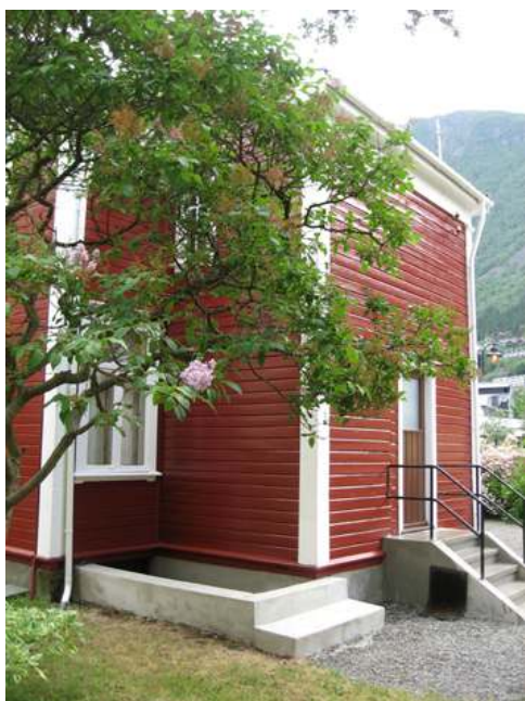
Nymåla Folgefonngata 9. Hagen er open for publikum og ligg som ein grøn oase i Odda sentrum.

Det vart utført utvendig maling av hovedhusa i Folgefonngata 9, 11 og 13. Hagen vart halden vedlike i samarbeid med APS.