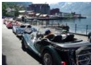
Morgan-besøk i Tyssedal.