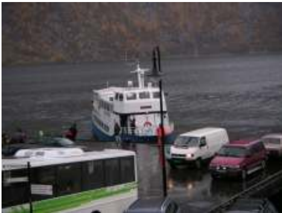
I 2008 vart vi nok ein gong frakta med båt mellom Odda og Tyssedal. 20. oktober gjekk det eit stort steinras på Tyssedalsvegen.

Det var fleire fast tilsette i permisjon/reduuerte stillingar. Grunna museet si økonomiske stode er fleire av desse ikkje erstatta med vikar. Det vart utført 12,45 årsverk i faste stillingar ved NVIM i 2008.