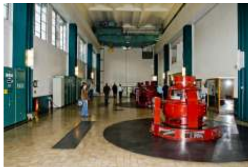
På "Kraftreisen" vitja vi mellom anna kraftstasjonen "Sauda III".

”Kraftreisen” – ei to dagars reise i vasskraft: historie, moderne drift og utbygging, lokale konsekvensar, kulturminnevern, småkraftutbygging, etc. Turen starta i Stavanger og gjekk vidare til Suldal, Sauda, Tyssedal og enda opp i Rosendal.